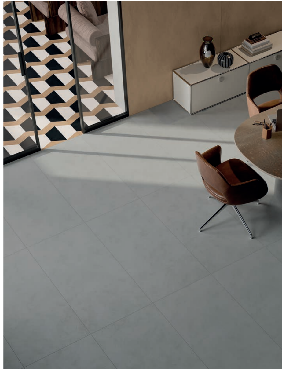
RESIN + PATTERN

The many inspirations behind the ABK range can be used to customise any space and create constantly changing material effects. Resin, stone, marble, wood and pattern are skilfully combined to create a surprising crossover style ideal for highly contemporary architectural solutions.