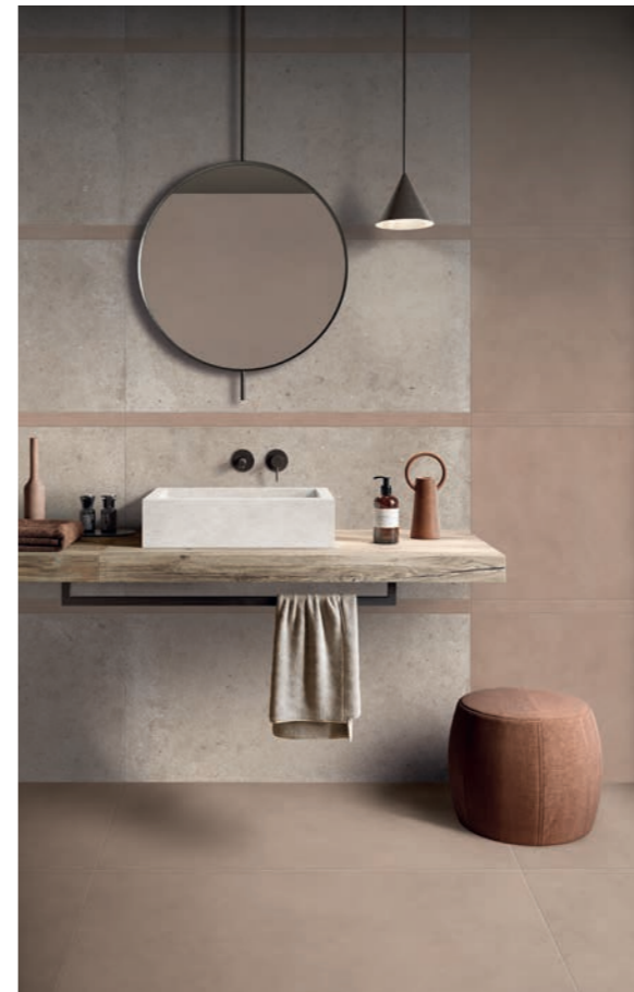
RESIN + STONE