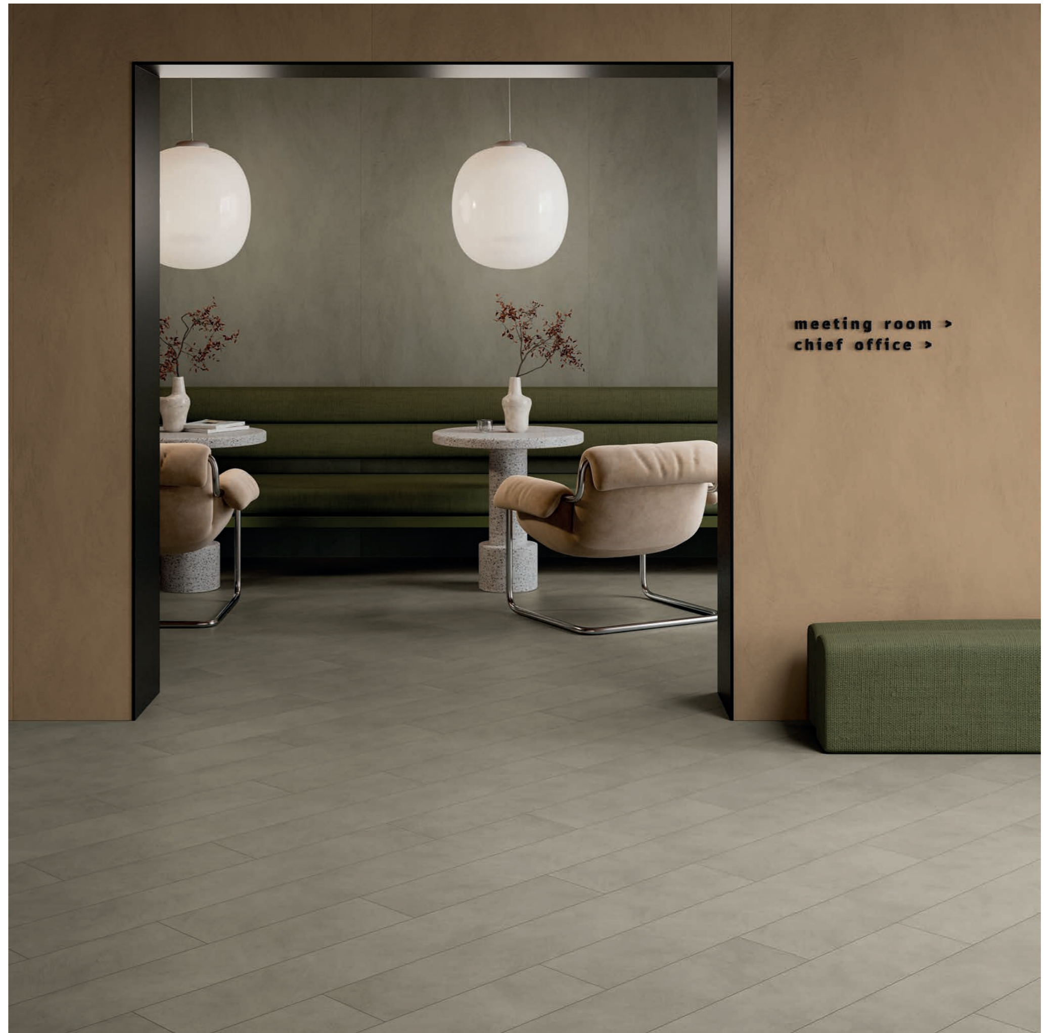
wall: ALTEREGO MUD 120x280 - MOU 120x280