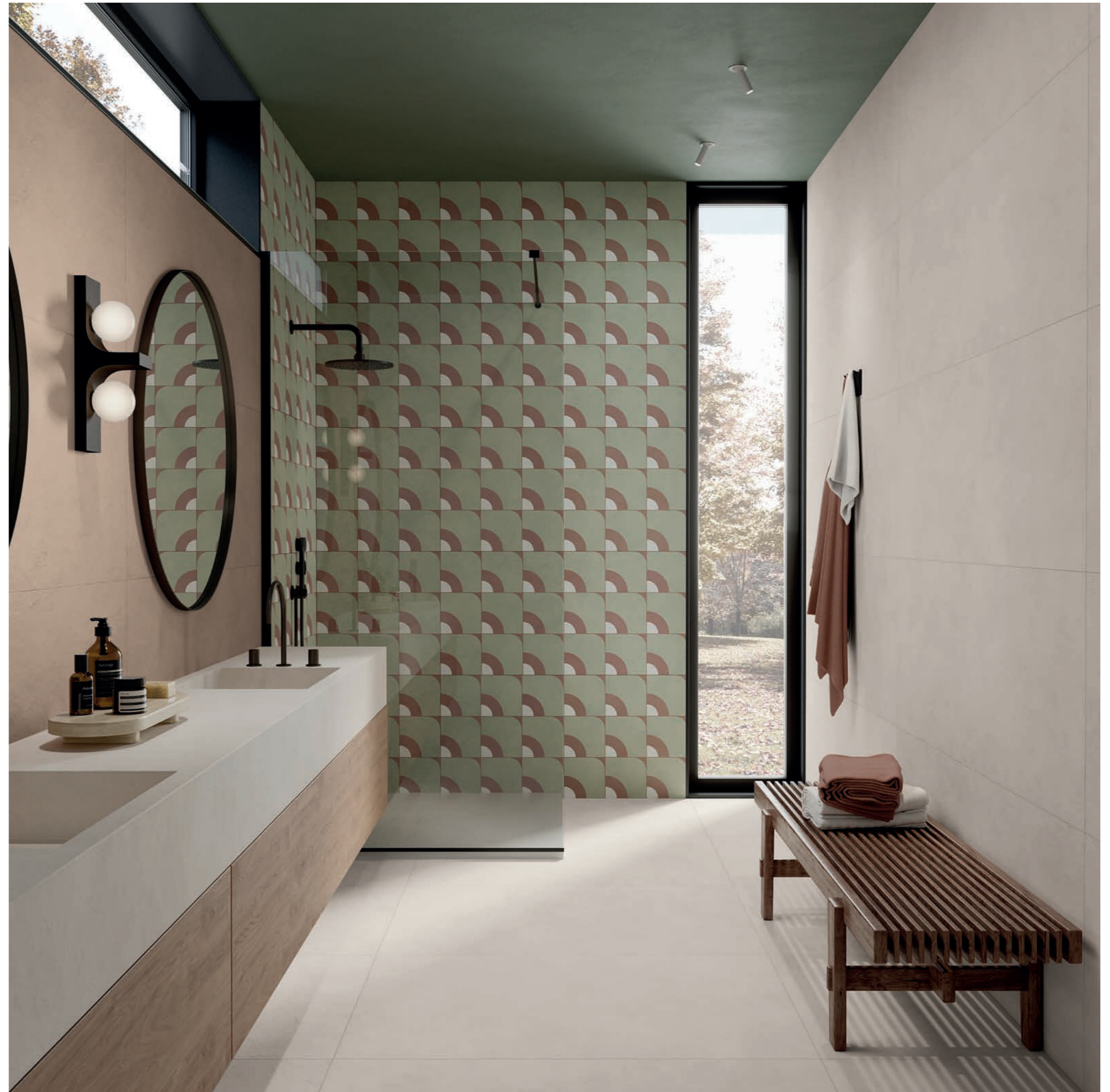
washbasin: ALTEREGO MILK 120x280