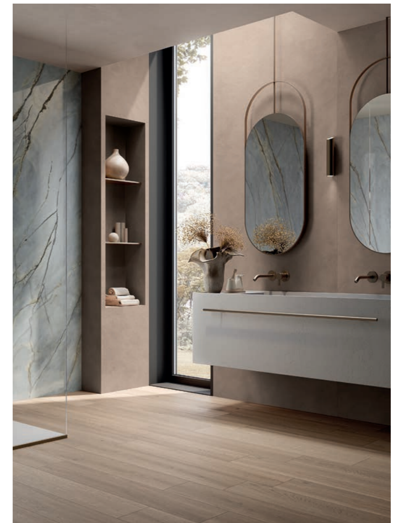
RESIN + WOOD