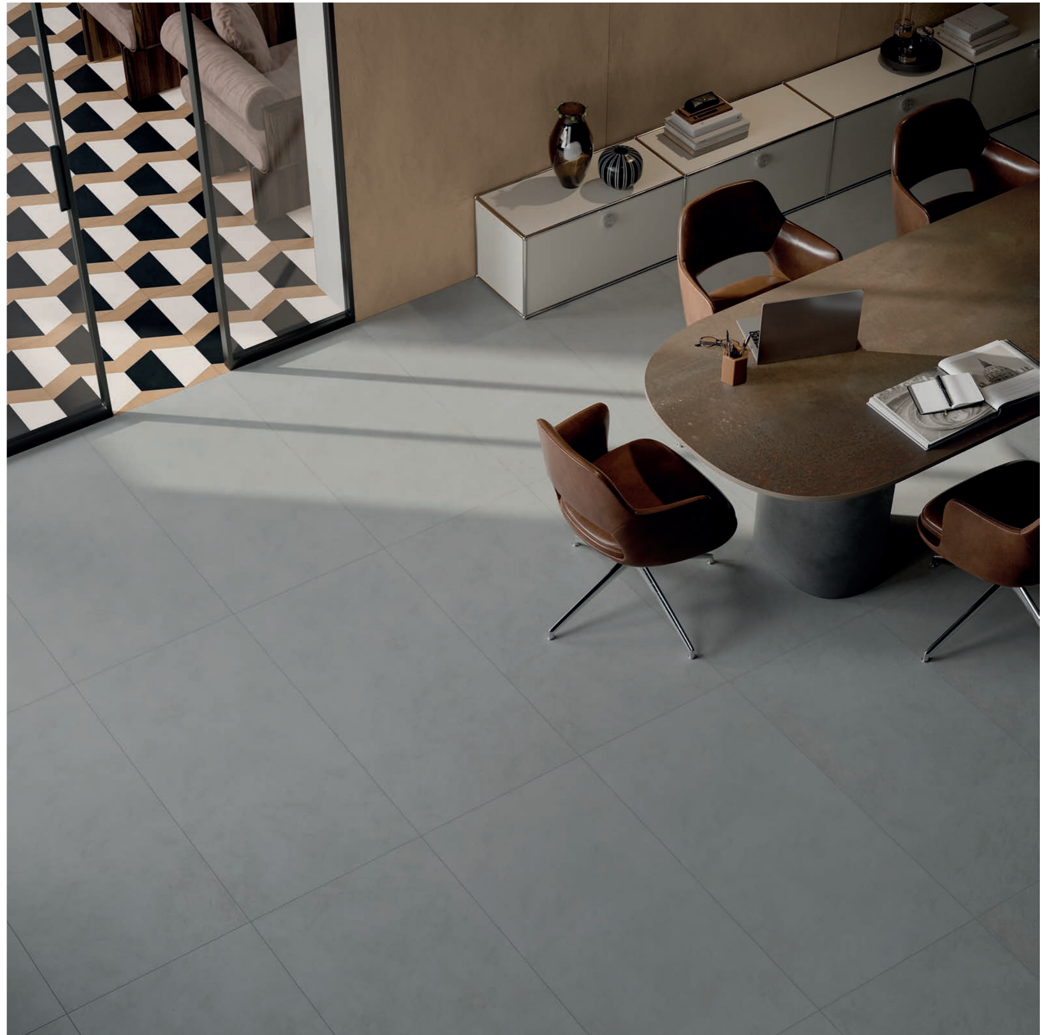
wall: ALTEREGO MOU 120x280 - table: ABKSTONE INTERNO 9 RUST 20mm