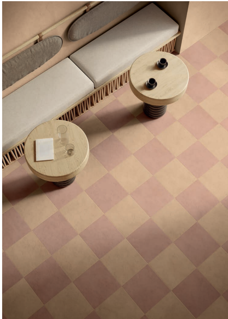
wall: ALTEREGO MOU 120x280