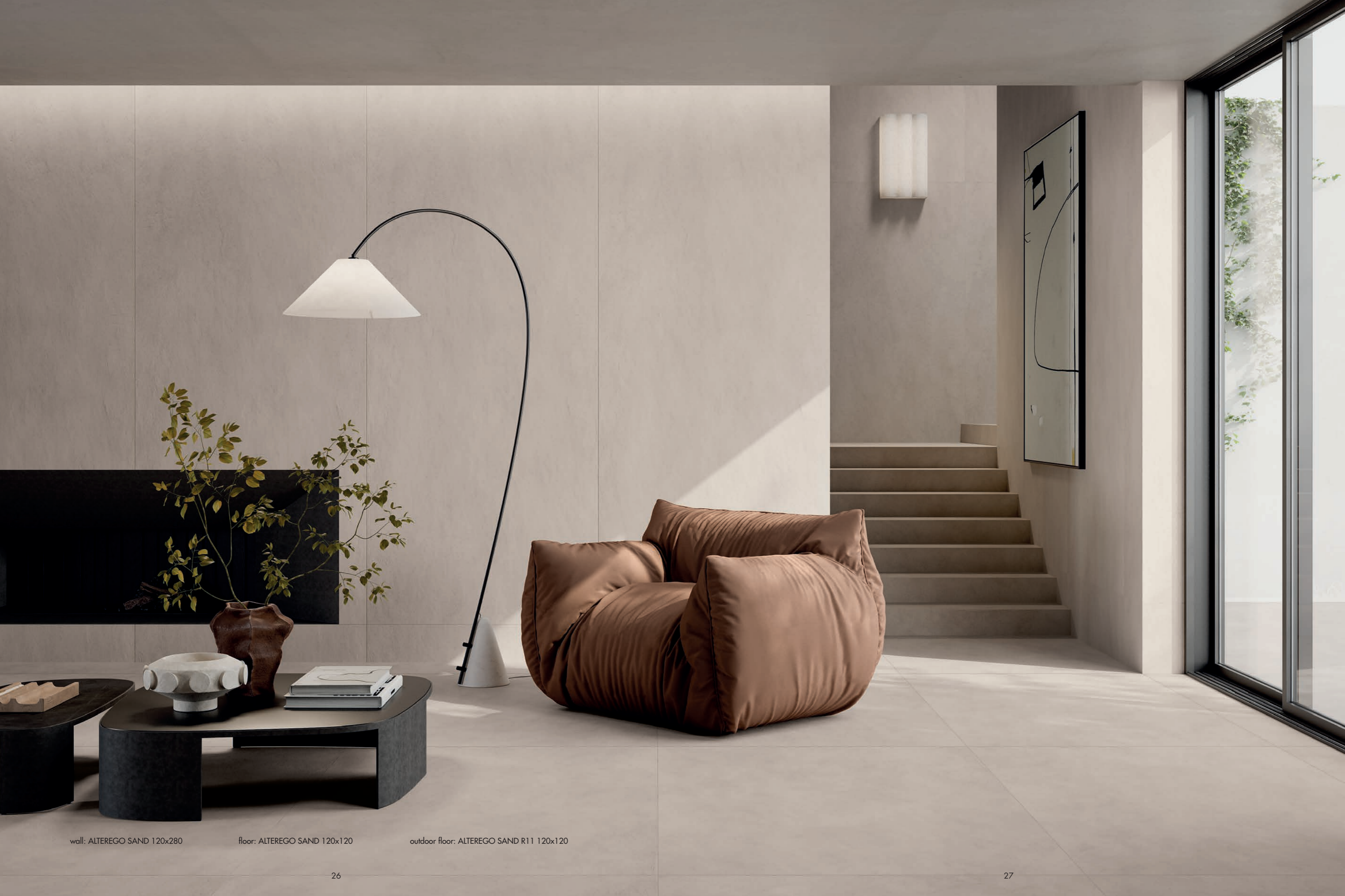
wall: ALTEREGO SAND 120x280