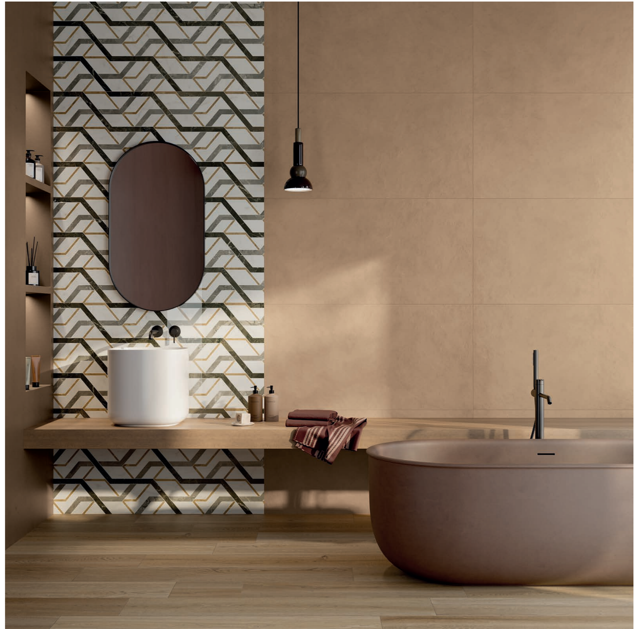
wall: ALTEREGO MOU 60x120 - SENSI FANTASY SPIDER LUX3D 60x120