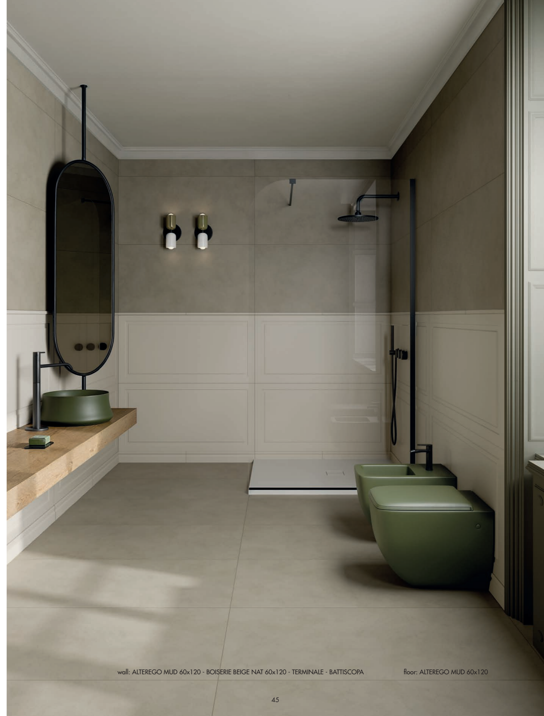
wall: ALTEREGO MUD 60x120 - BOISERIE BEIGE NAT 60x120 - TERMINALE - BATTISCOPA floor: ALTEREGO MUD 60x120