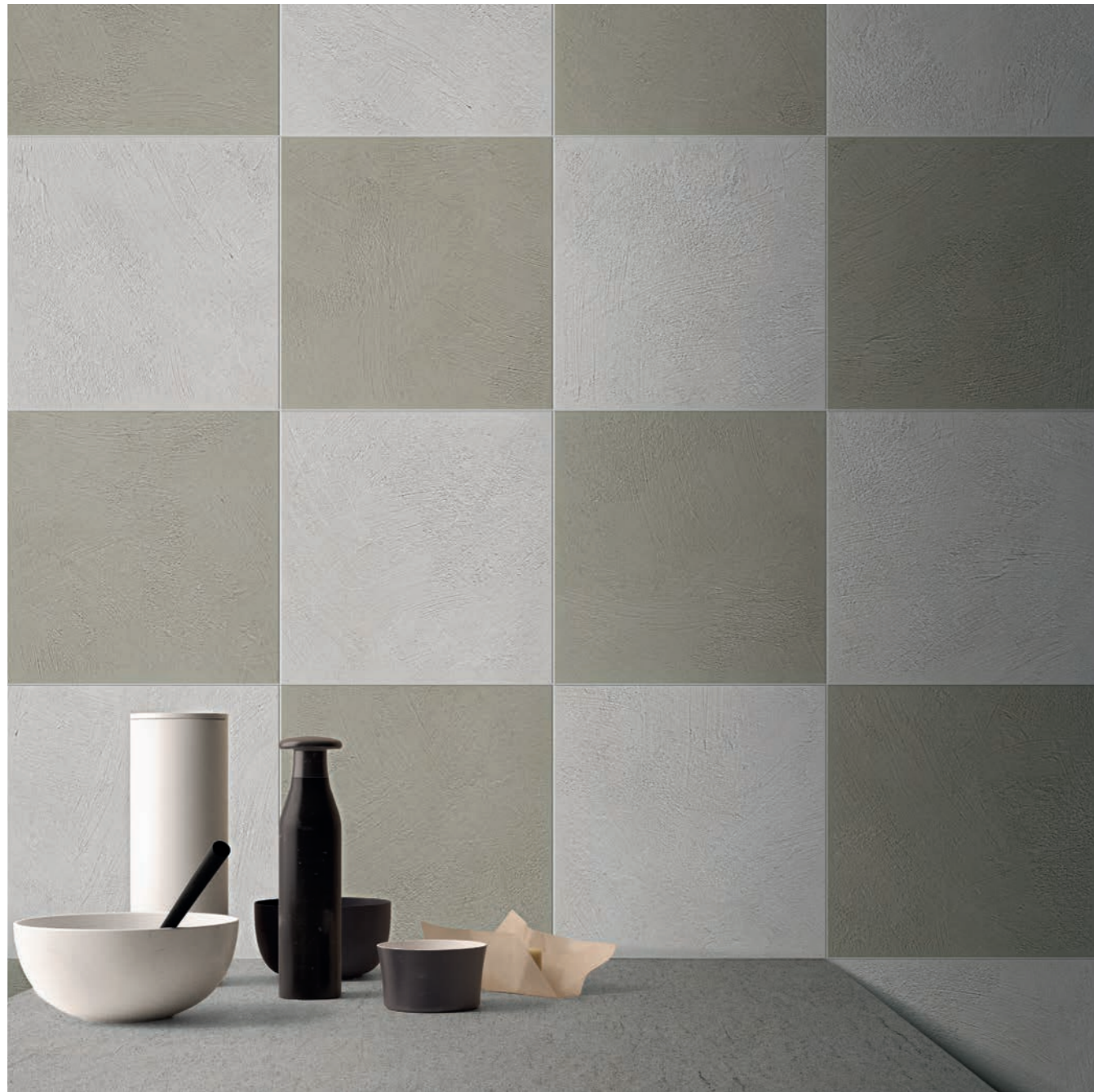
wall: ALTEREGO ASH 30x30 - MUD 30x30