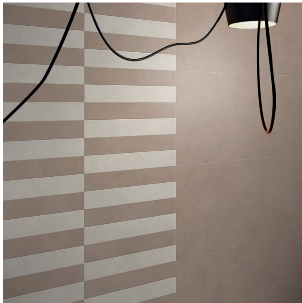
wall: ALTEREGO BARK 60x120 - 10x60 - SAND 10x60