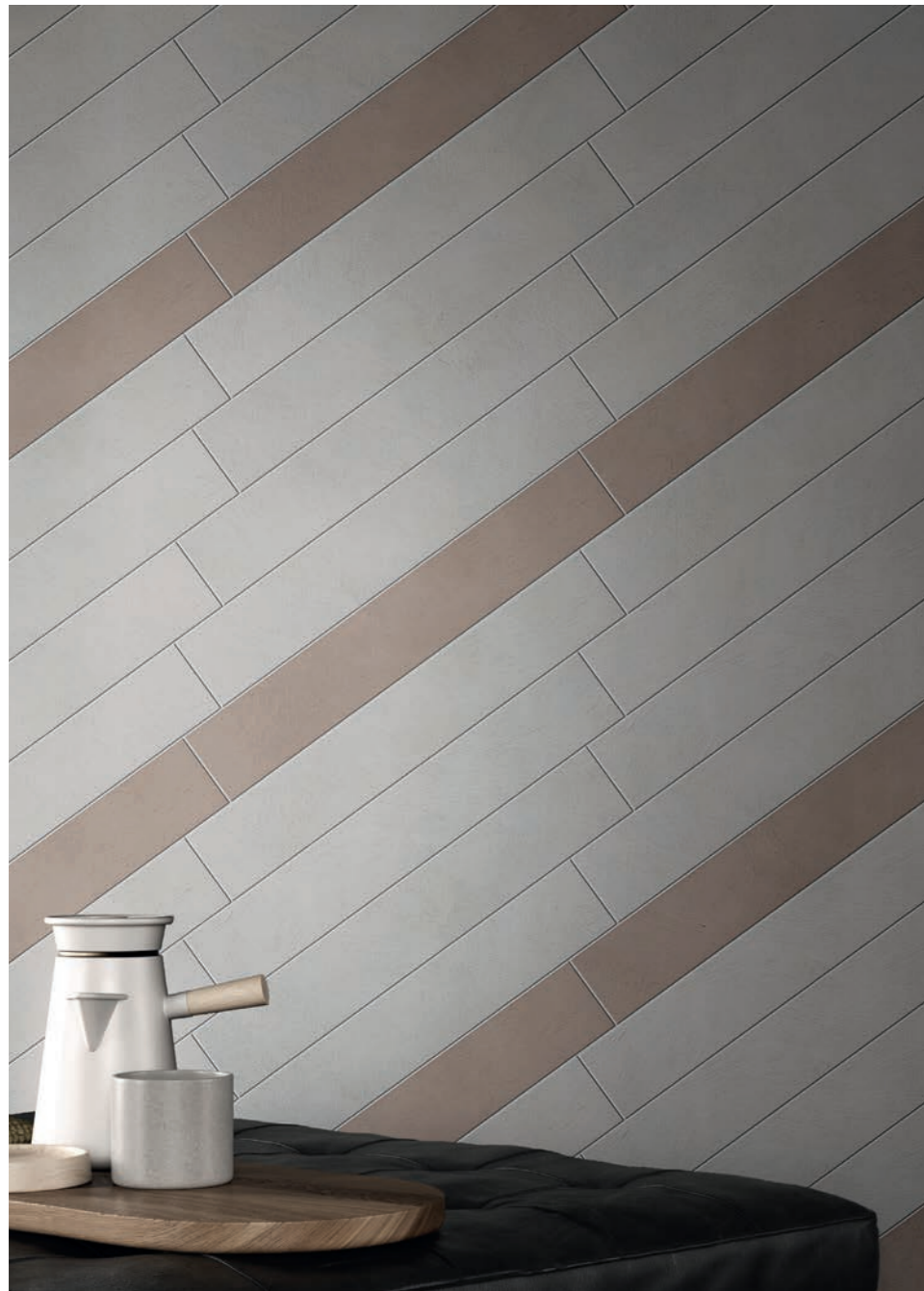
wall: ALTEREGO ASH 10x60 - BARK 10x60