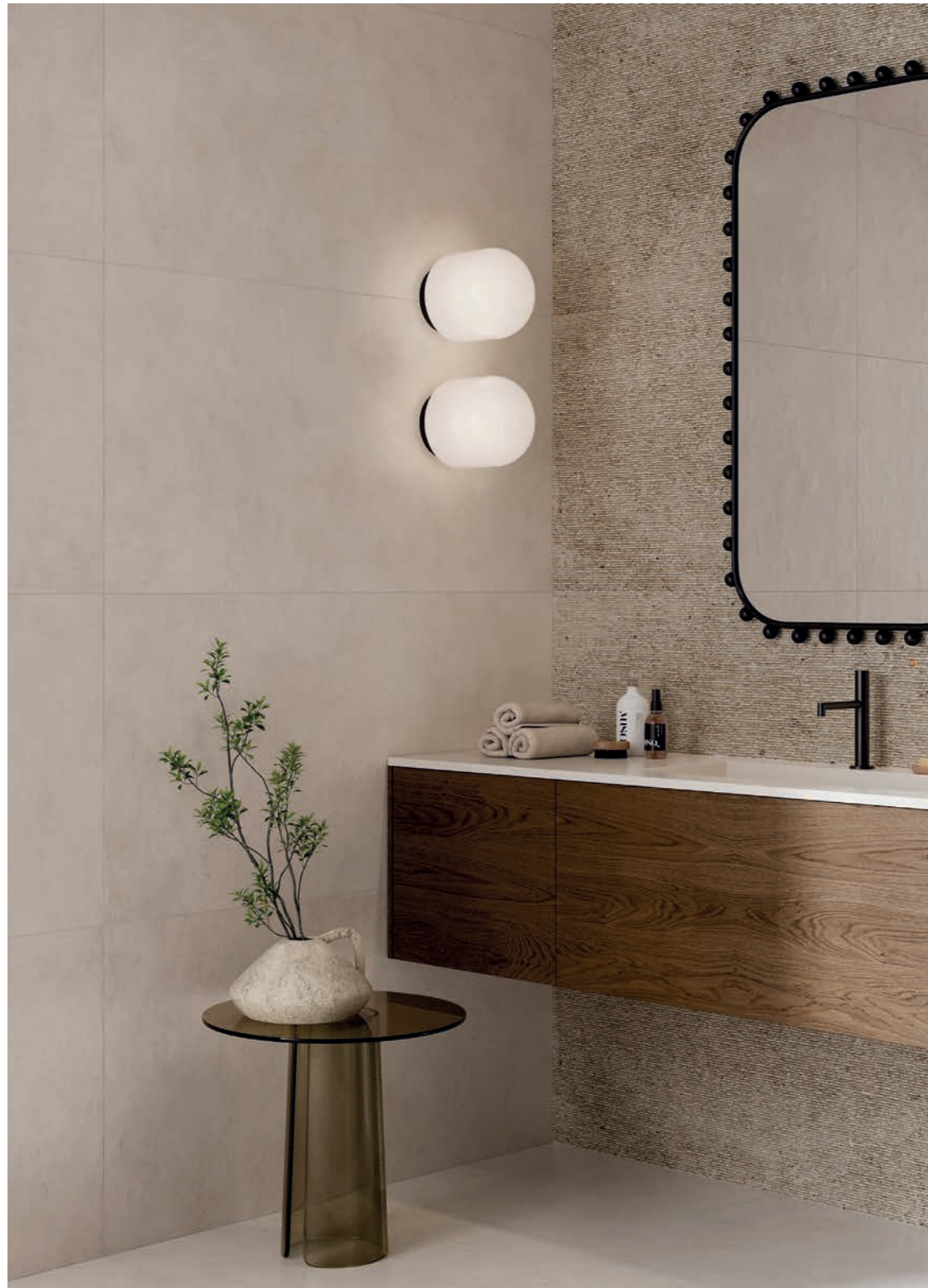
wall: ALTEREGO SAND 60x120 - POETRY STONE CARVING ECRU 60x120