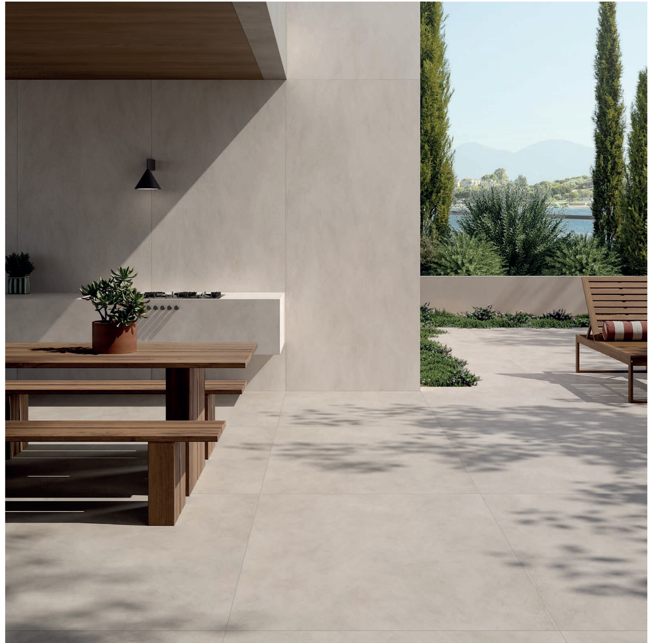
wall: ALTEREGO SAND 120x280