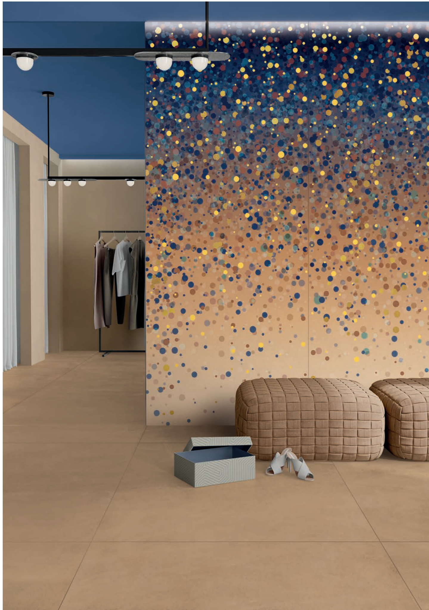
wall: WIDE&STYLE CONFETTI BLUE 120x280