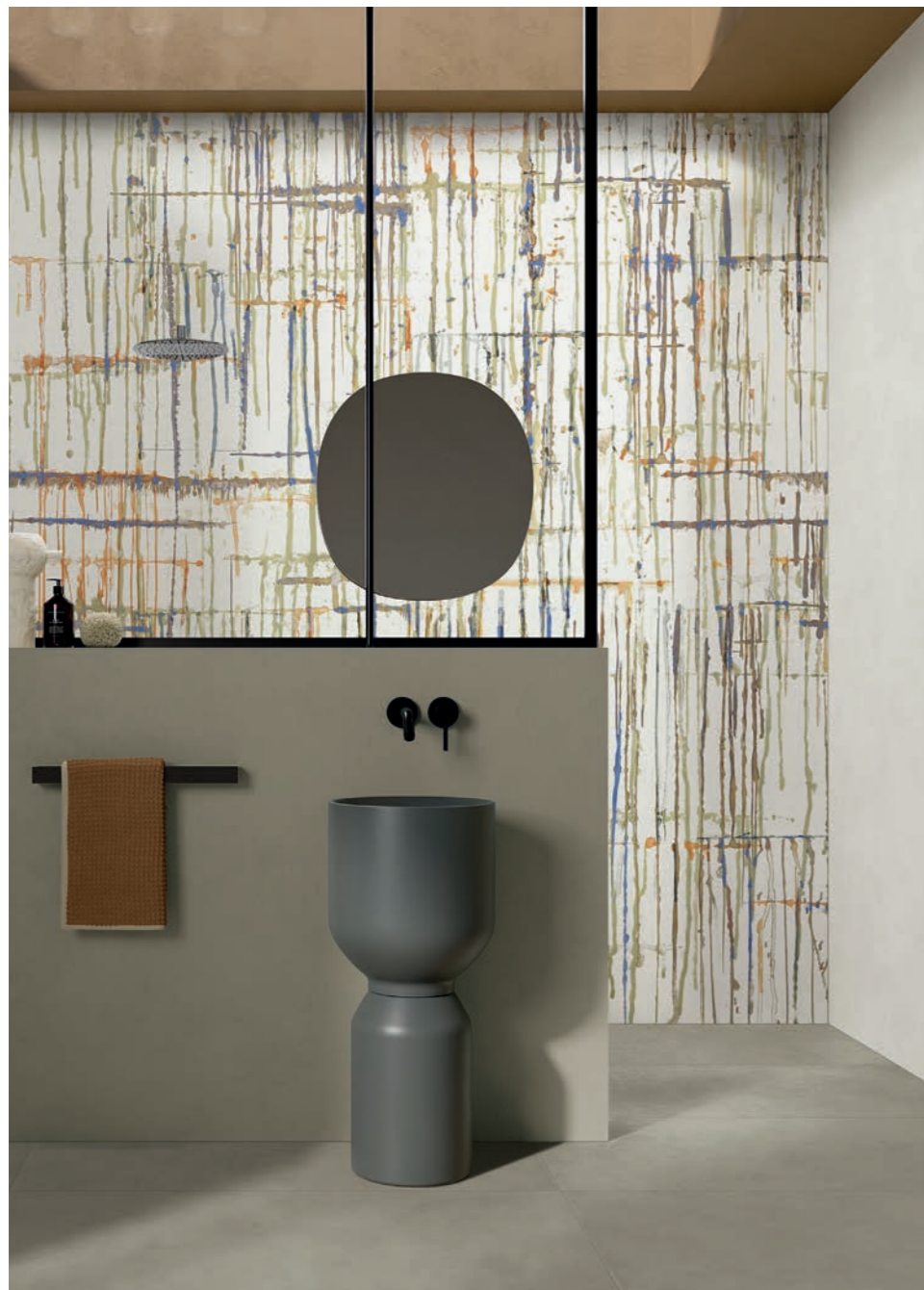
wall: ALTEREGO MILK 120x280 - MUD 60x120 - WIDE&STYLE DRIPPING LUX 120x280 floor: ALTEREGO MUD 60x120