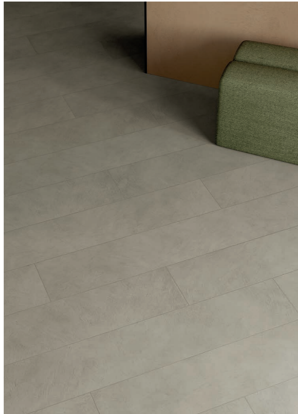
floor: ALTEREGO MUD 20x120