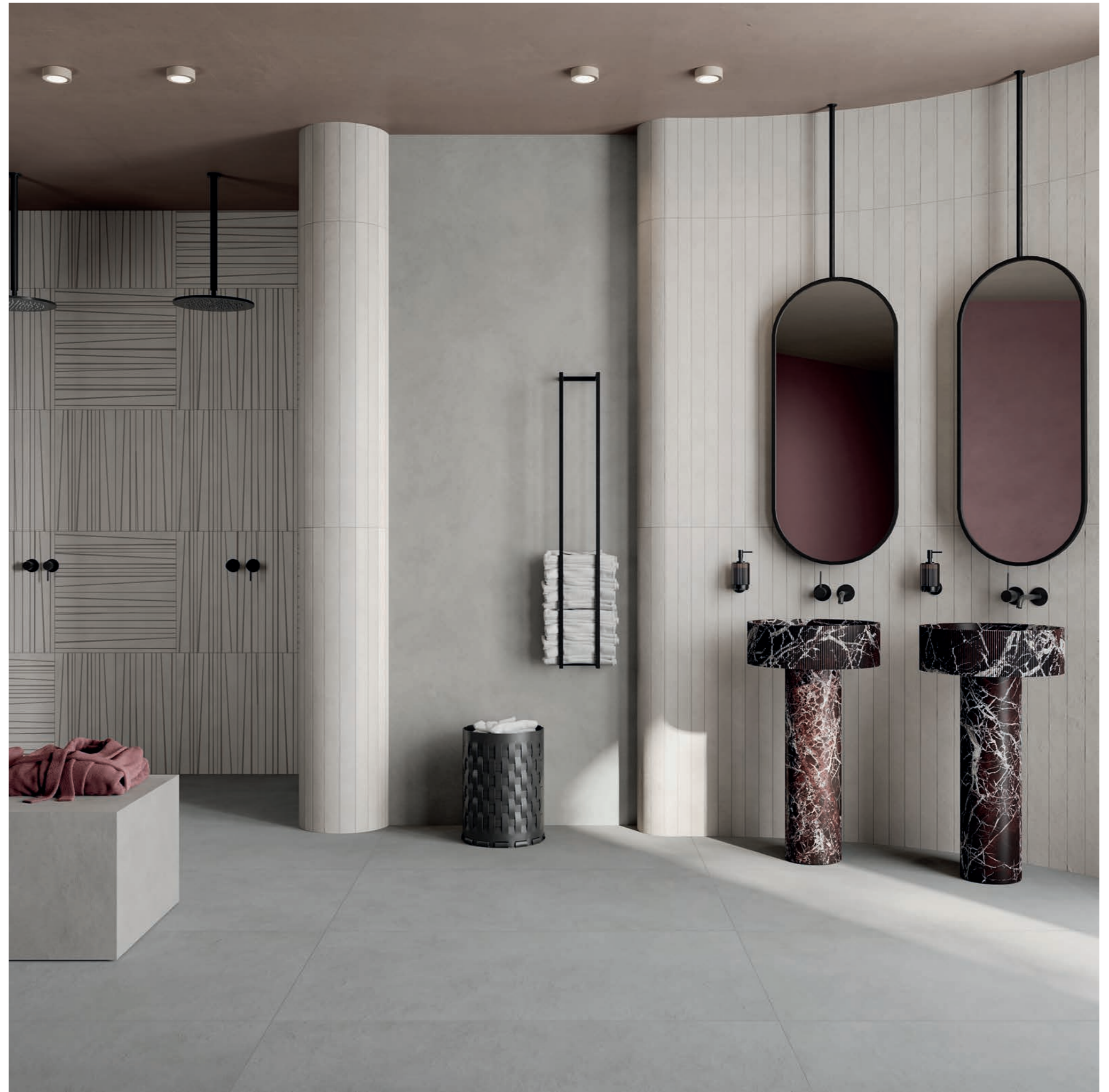
wall: ALTEREGO ASH 120x280 - MILK 5x120 - 14ORAITALIANA STICKS MILK 10x60