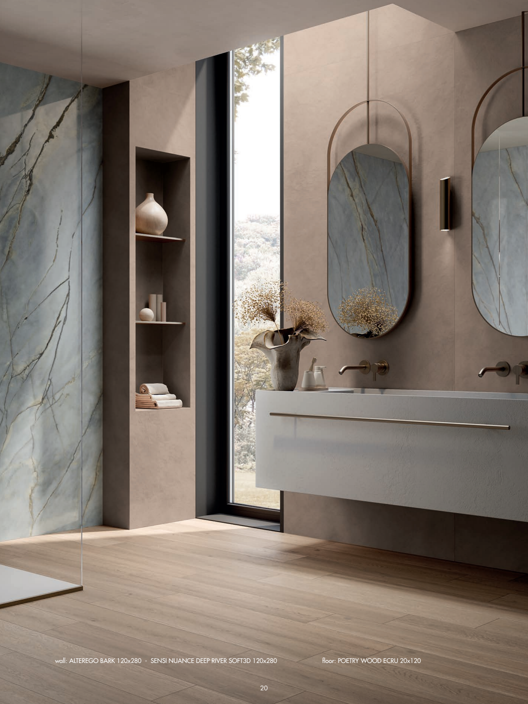
wall: ALTEREGO BARK 120x280 - SENSI NUANCE DEEP RIVER SOFT3D 120x280