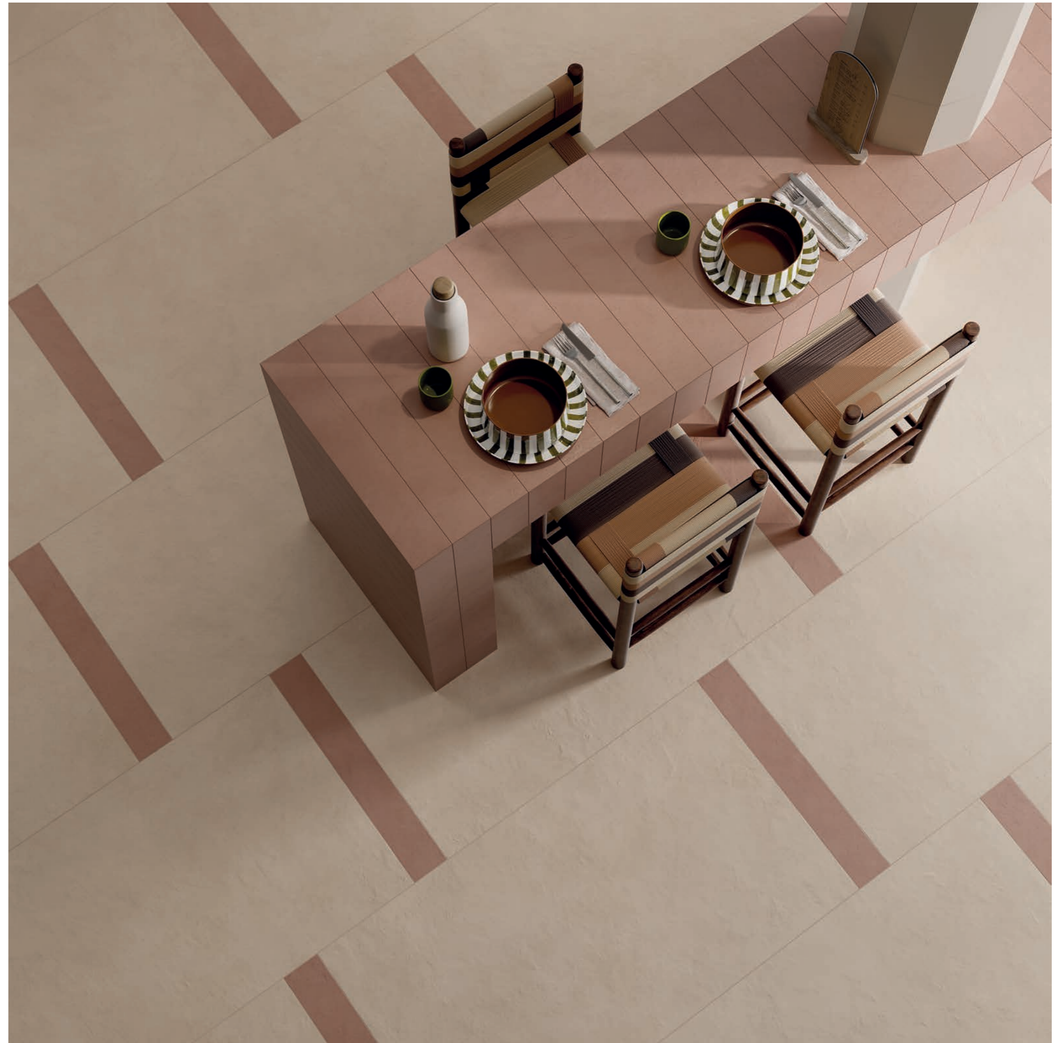
floor: ALTEREGO CREAM 60x120 - COTTO 10x60