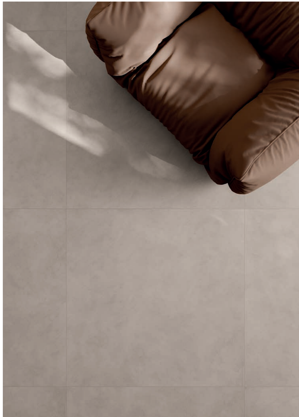
floor: ALTEREGO SAND 120x120