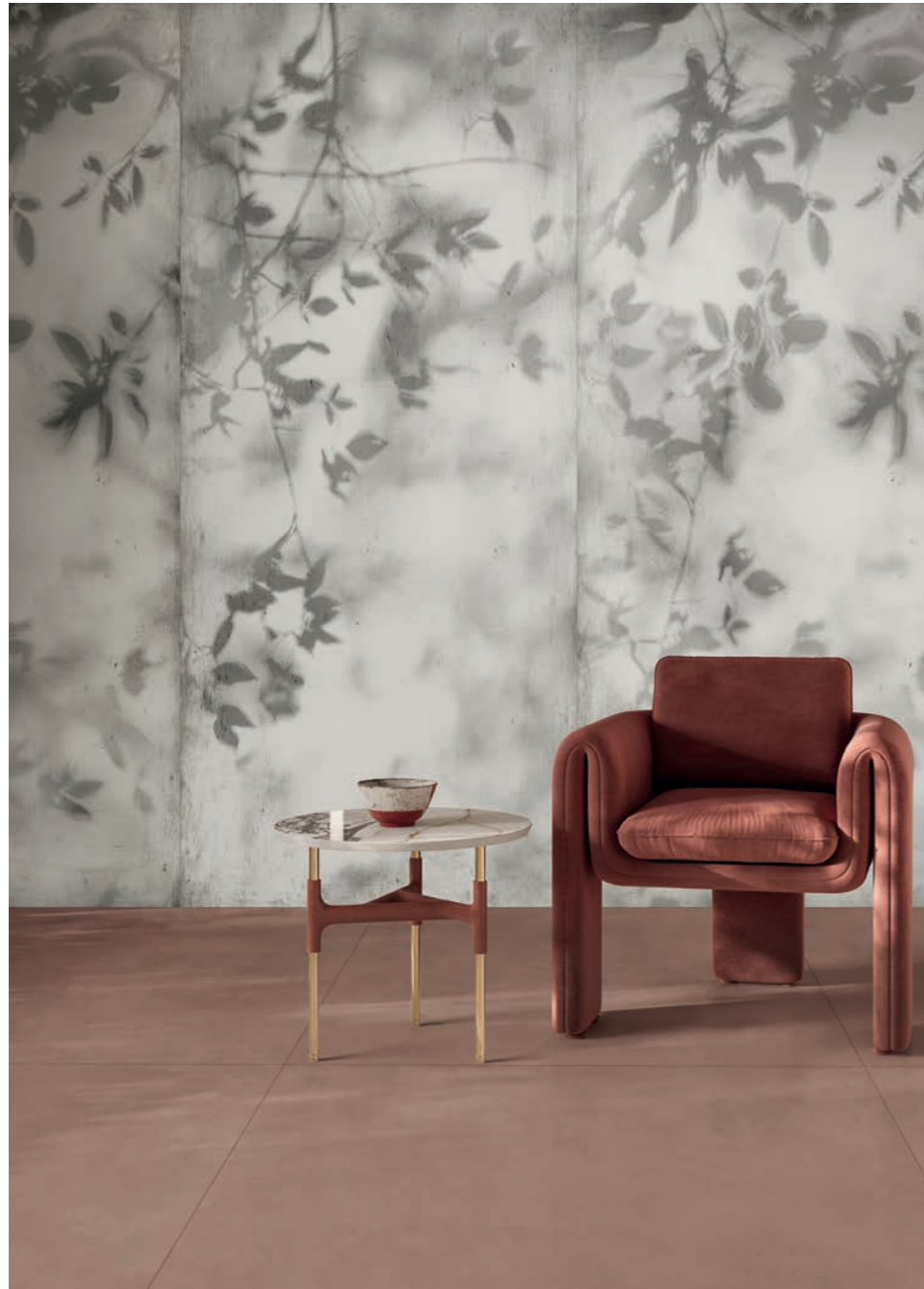
wall: WIDE&STYLE SHADOW 120x280