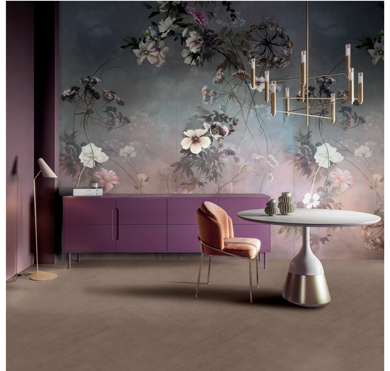
wall: WIDE&STYLE COUNTRY FLOWERS PINK 120x280