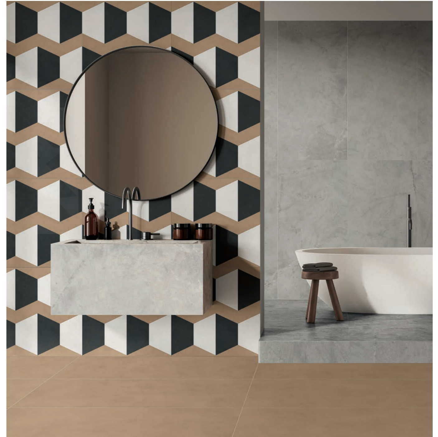
wall: 14ORAITALIANA HEXAGON 60x60 - ATLANTIS GREY 60x120 - floor: ALTEREGO MOU 60x120 - ATLANTIS GREY 60x120