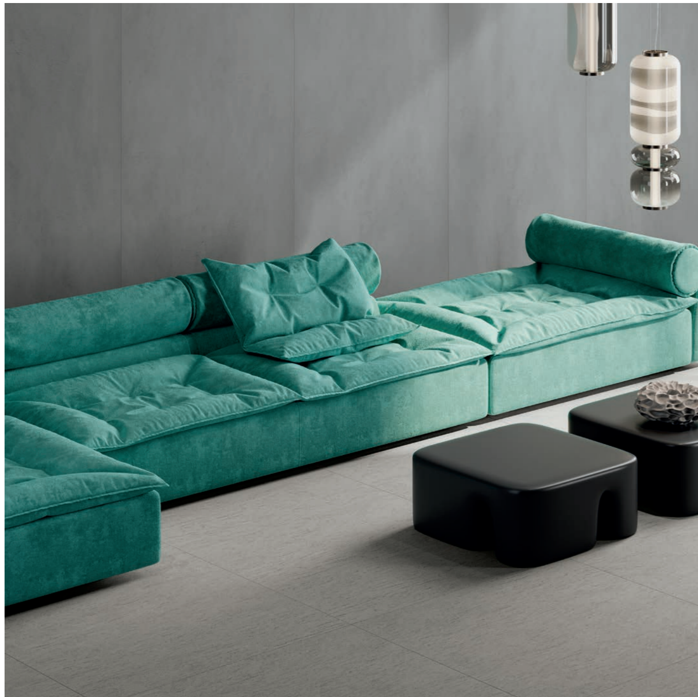
wall: ALTEREGO CONCRETE 120x280