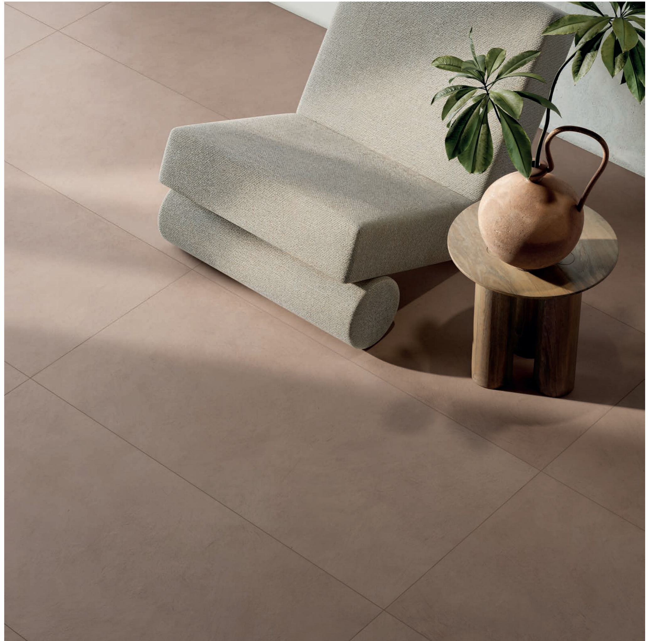
floor: ALTEREGO BARK 60x120