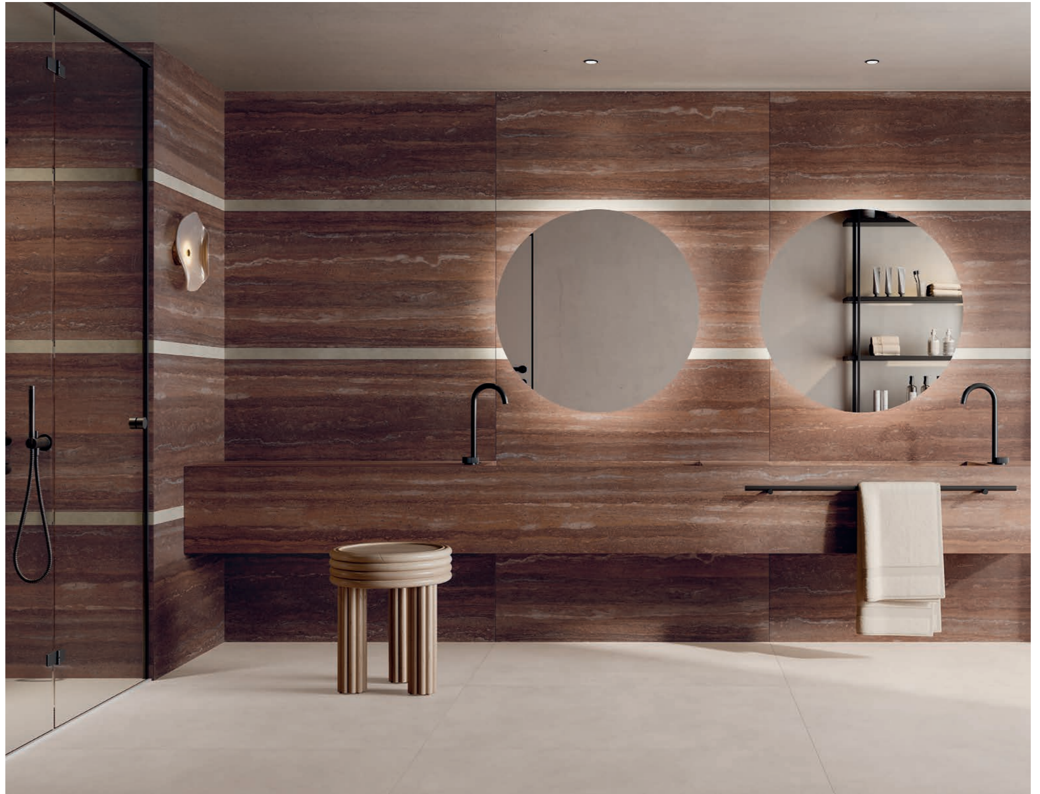
washbasin top: SENSI ROMA RED 120x280