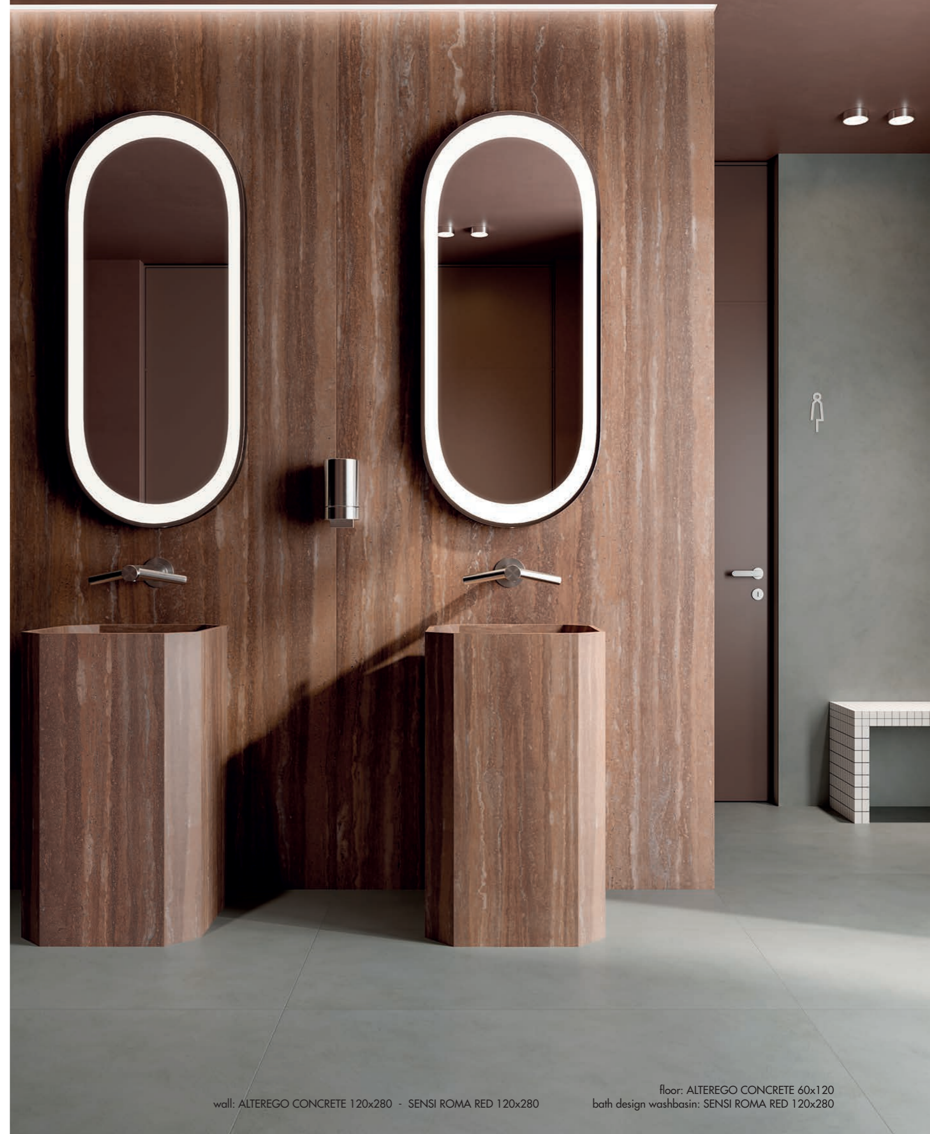
wall: ALTEREGO CONCRETE 120x280 - SENSI ROMA RED 120x280