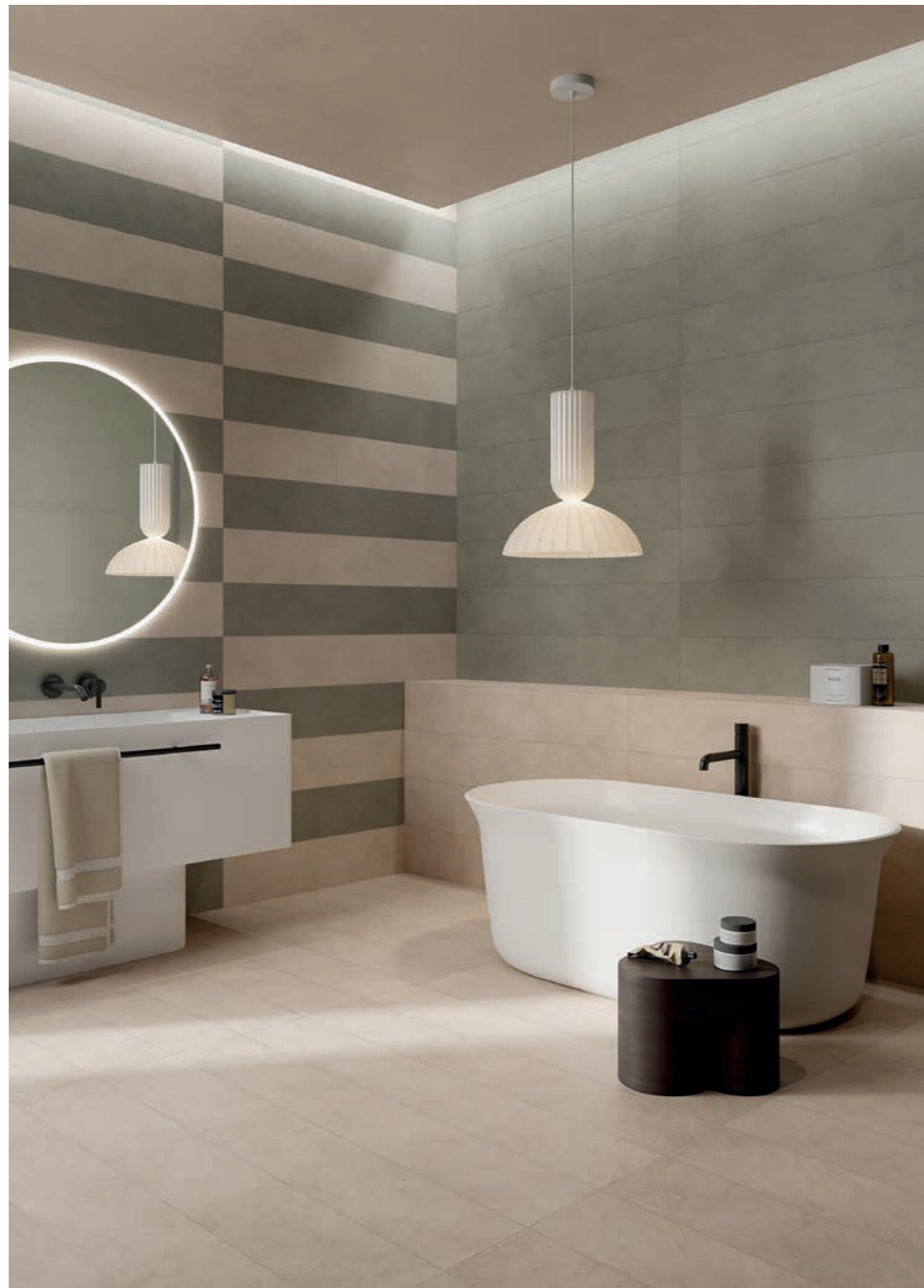
wall: ALTEREGO CREAM 20x120 - MUD 20x120