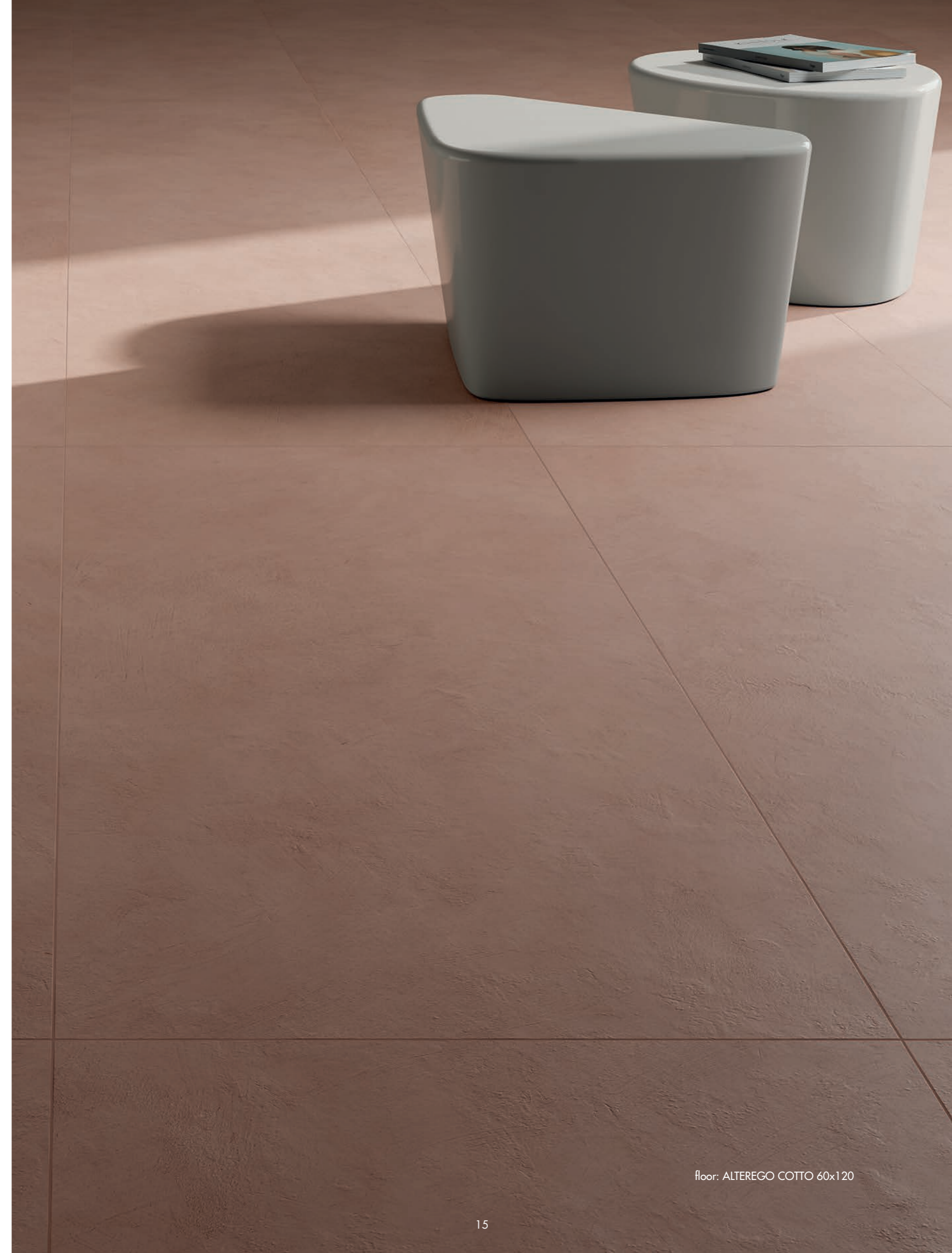
floor: ALTEREGO COTTO 60x120