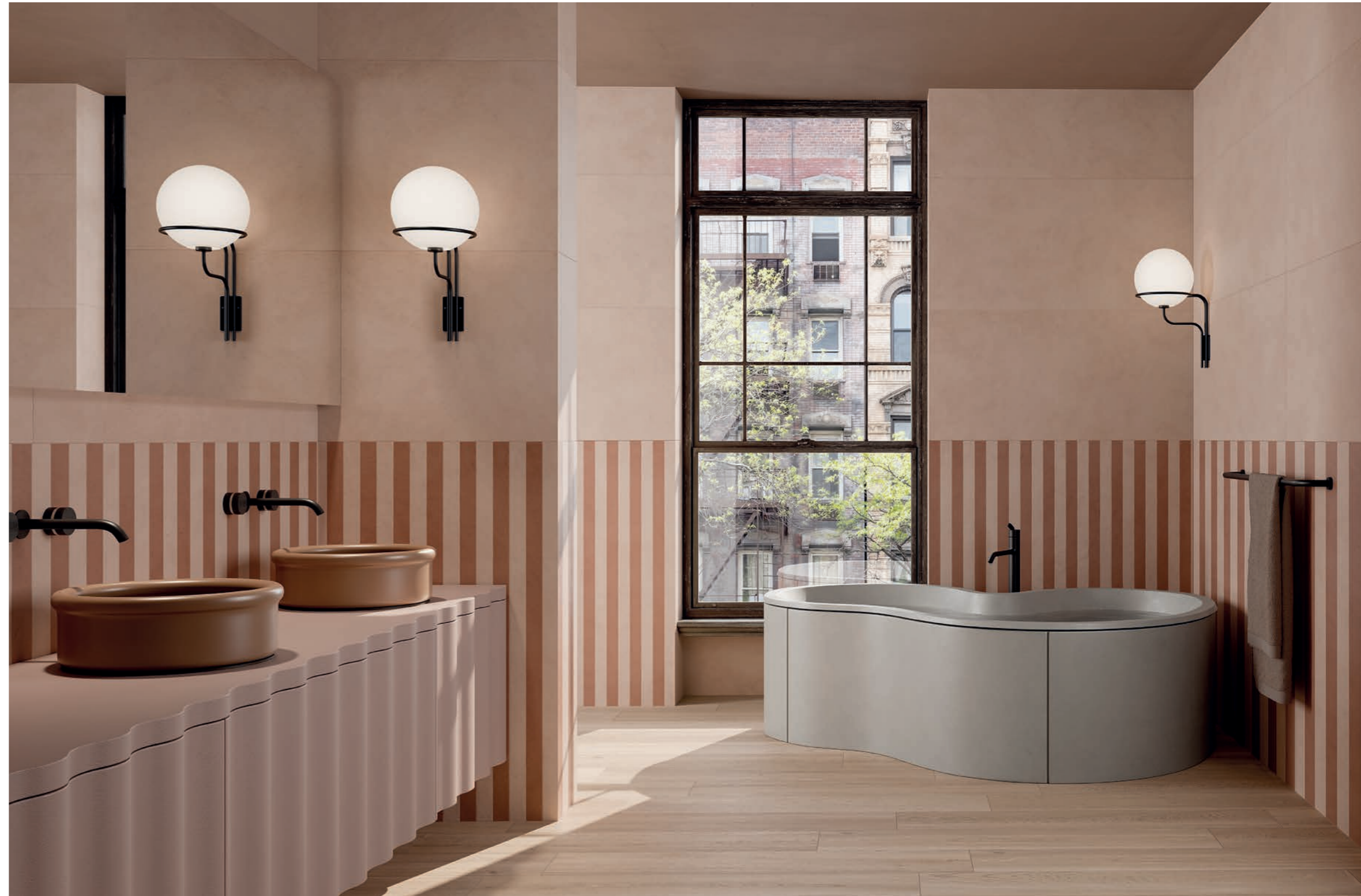
wall: ALTEREGO CLAY 120x280