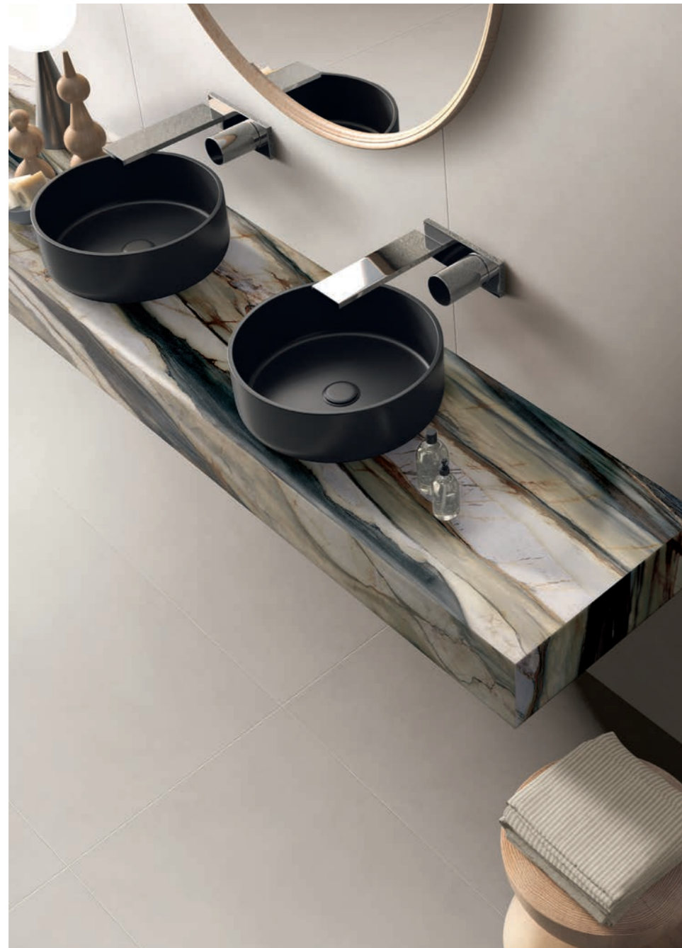
wall: ALTEREGO MILK 120x280 top: SENSI 900 OYSTER GOLD LUX 120x280