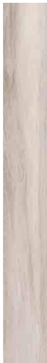
SILVERLINE AVORIO 15x120 ▲ 68