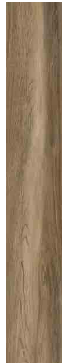
SILVERLINE TORTORA 20x120 ▲ 68