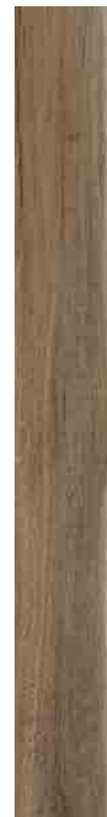
SILVERLINE TORTORA 15x120 ▲ 68