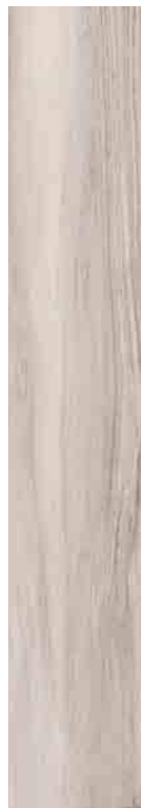
SILVERLINE AVORIO 20x120 ▲ 68