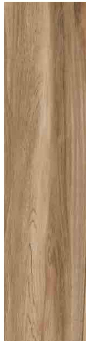
SILVERLINE NOCCIOLA 30x120 ▲ 63