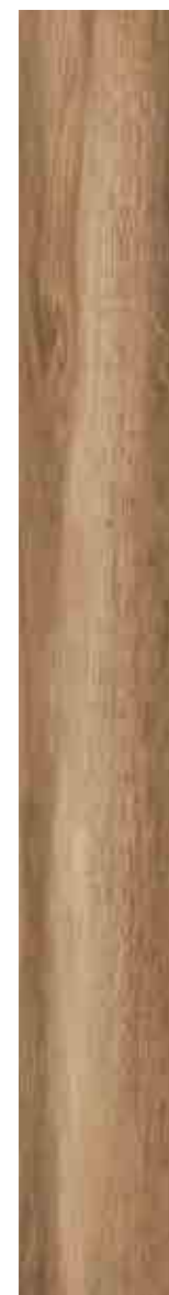
SILVERLINE NOCCIOLA 15x120 ▲ 68