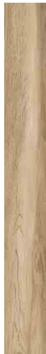
SILVERLINE MIELE 15x120 ▲ 68