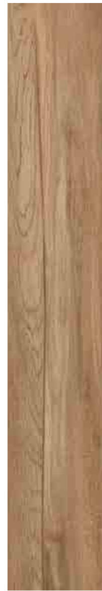
SILVERLINE NOCCIOLA 20x120 ▲ 68