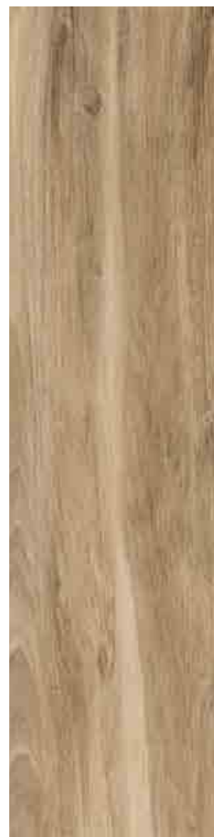
SILVERLINE MIELE 30x120 ▲ 63