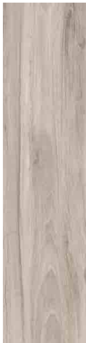
SILVERLINE AVORIO 30x120 ▲ 63

RETTIFICATO Rectified - Rectifié - Rektifiziert UNI EN 14411 - G B1a