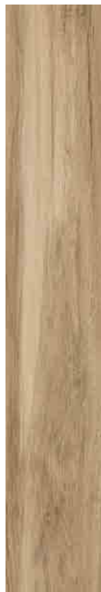
SILVERLINE MIELE 20x120 ▲ 68