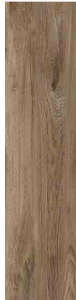
SILVERLINE TORTORA 30x120 ▲ 63