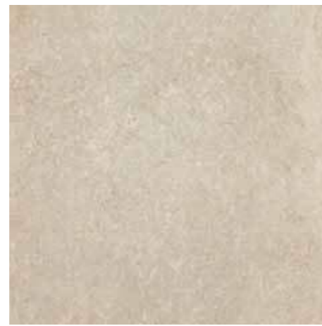
HSU 201 Rett. □ 60x60 - 24"x24" □ 168