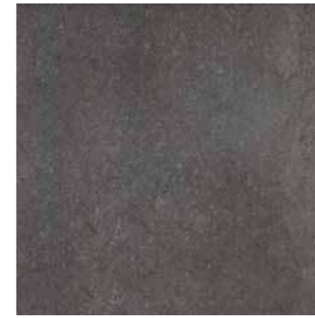
HSU 208 60x60 - 24"x24" □ 146