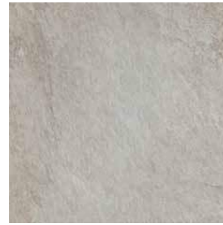
HSU 205 Rett. □ 60x60 - 24"x24" □ 168