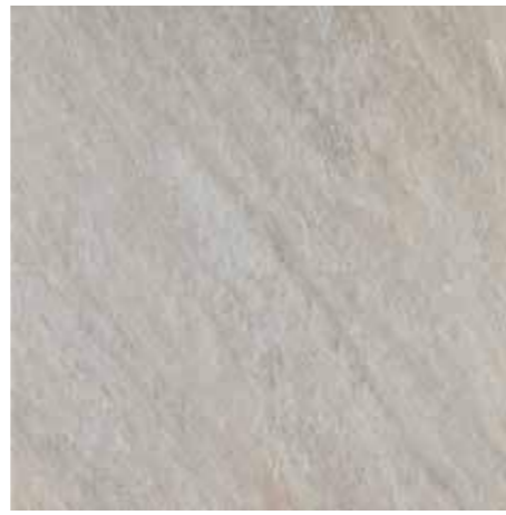
HSU 205 60x60 - 24"x24" □ 146