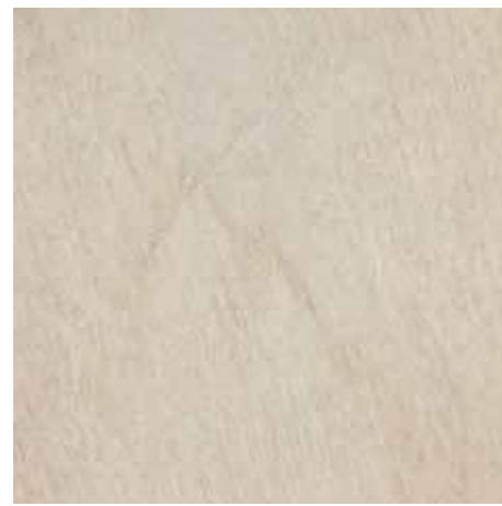
HSU 201 60x60 - 24"x24" □ 146