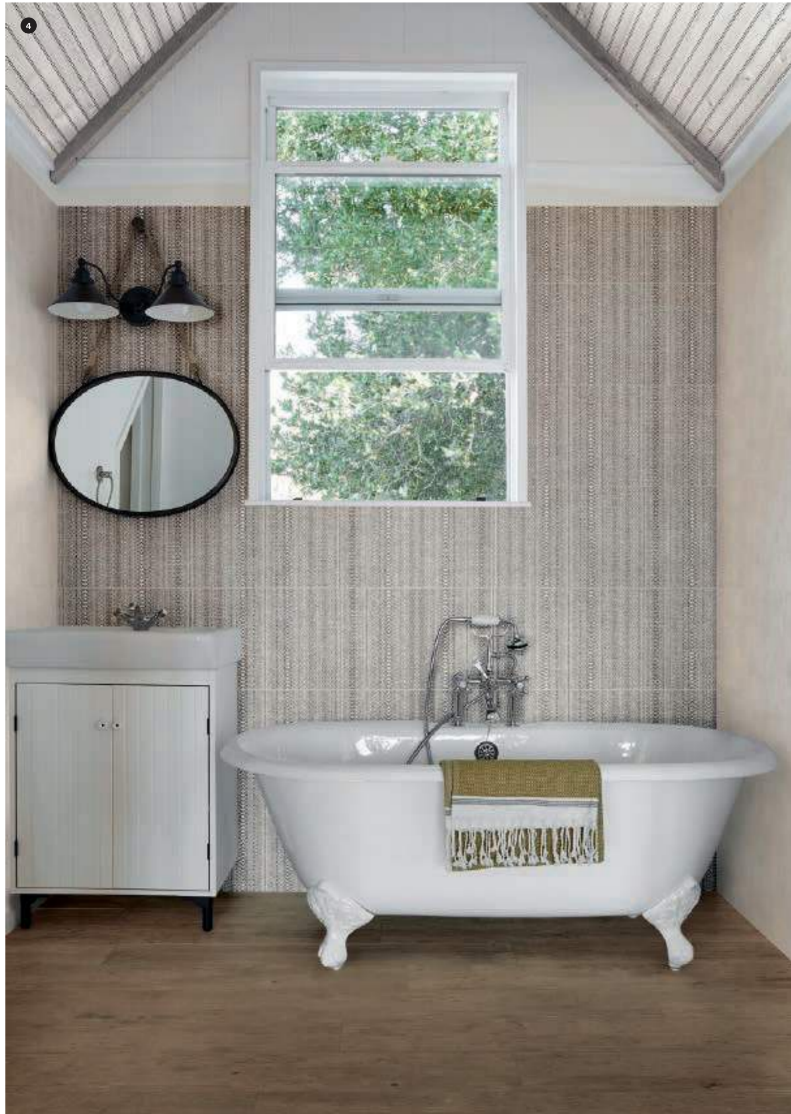
4 MQUT Fabric Cotton 40x120 MEIM Decoro Canvas 40x120 MZUD Treverkdear Brown Rett. 25x150