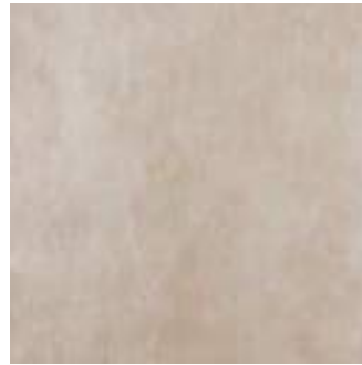
MMCM Plaster20 Sand 60x60