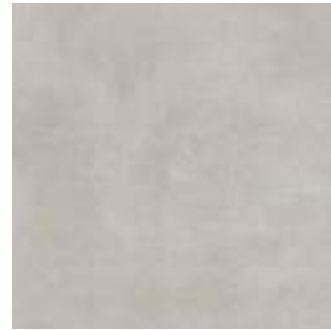
MMCN Plaster20 Grey 60x60