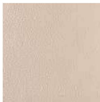
MLR7 SistemN20 Sabbia 60x60