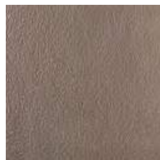
MLR8 SistemN20 Tortora 60x60