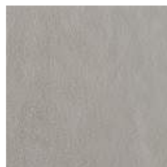
MLRA SistemN20 Grigio Medio 60x60