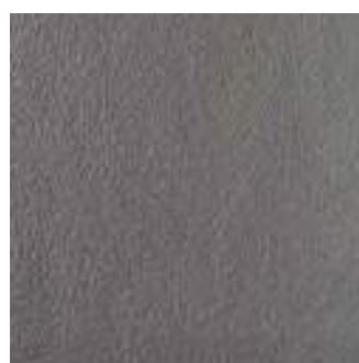
MLRC SistemN20 Grigio Scuro 60x60

Pezzi Speciali Special Trims Pièces Spéciales Formteile Piezas Especiales Специальные Изделия