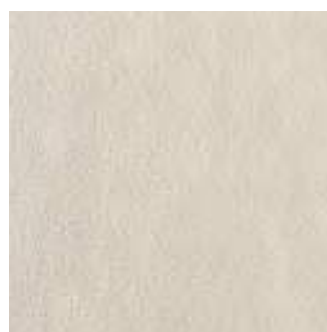
MLR9 SistemN20 Grigio Chiaro 60x60