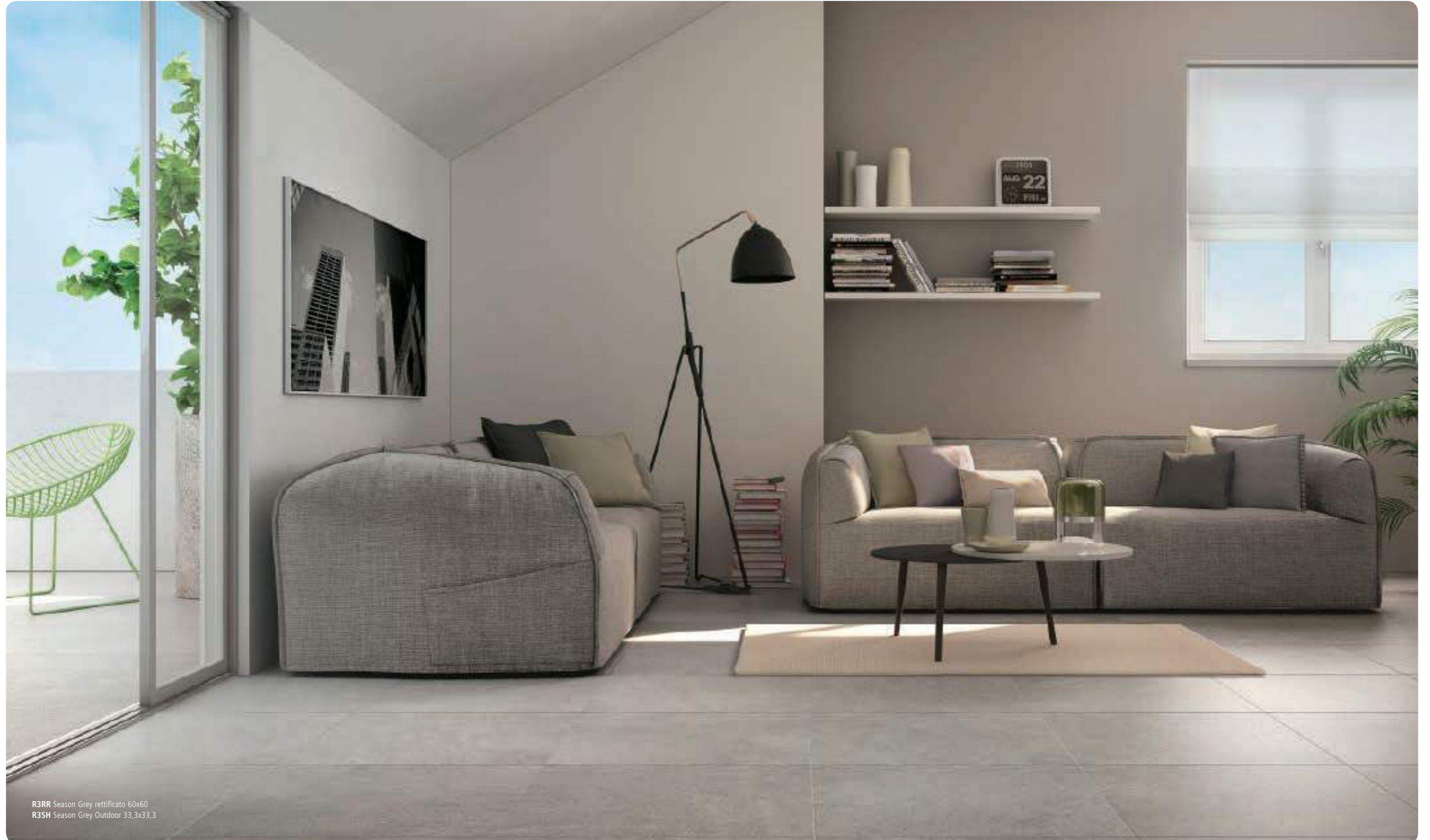
R3RR Season Grey rettificato 60x60 R3SH Season Grey Outdoor 33,3x33,3